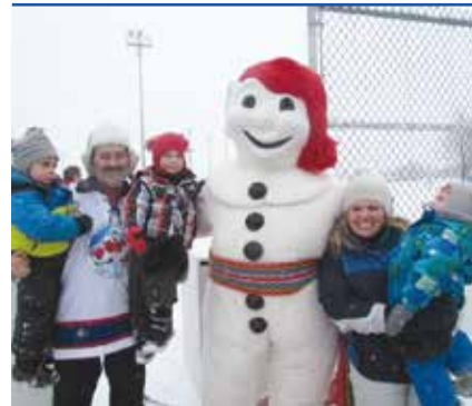
Les 3 petits fils de M. Clusiaux: on joue dehors!

« Le bonheur est la seule chose qui se multiplie quand on le partage » (Albert Schweitzer)