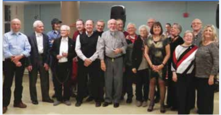
Des laryngectomisés à la fête de Noël

L'inquiétude, c'est comme marcher dans la rue avec un parapluie ouvert en attendant qu'il pleuve. (Franck Nicolas)