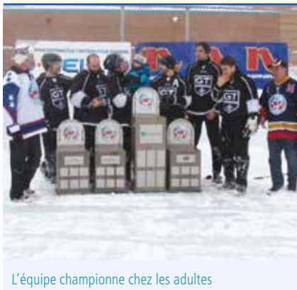
L'équipe championne chez les adultes