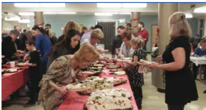
... un bon repas...