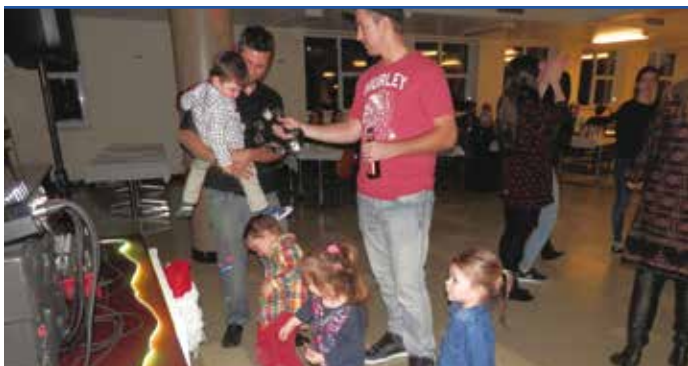
Les enfants à la danse....