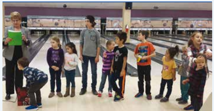
Les petits enfants: le bonheur!