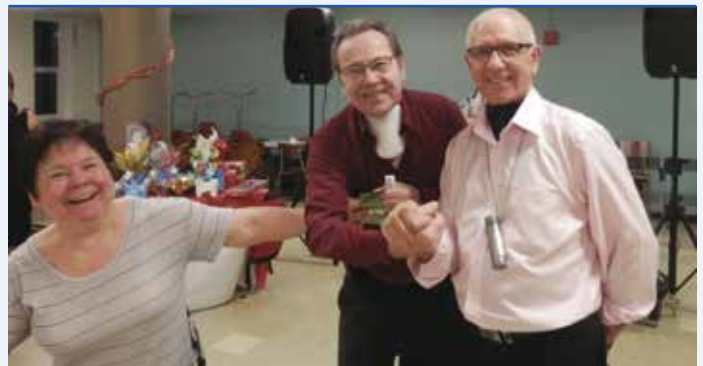
On se taquine