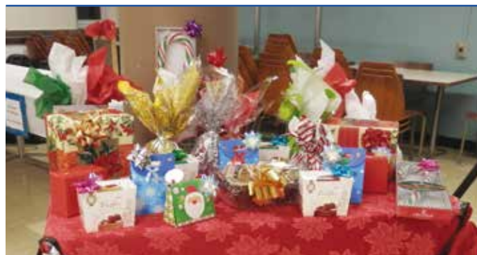
...et des cadeaux.