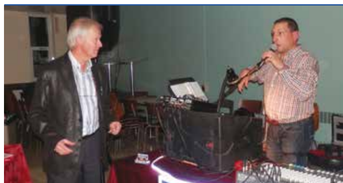
De la musique...