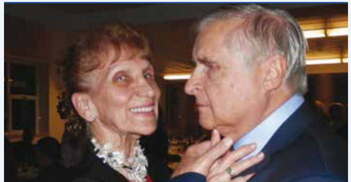
Danser, pourquoi pas ?