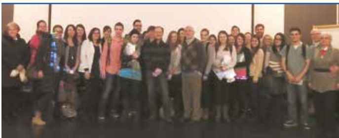
Cégep Granby-Haute Yamaska

L'intérêt des étudiants est palpable et la générosité des « voyageurs » toujours au rendez-vous.