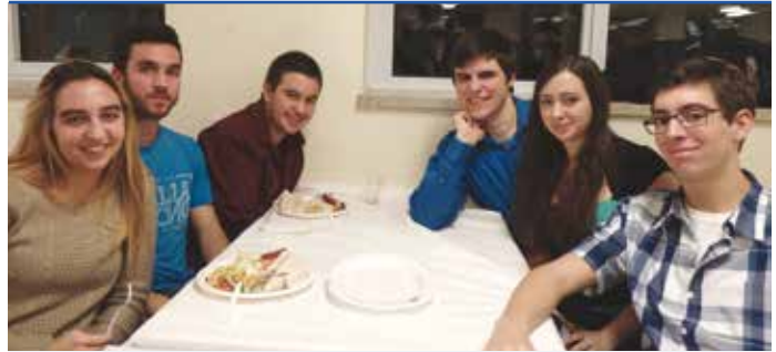
Du plaisir pour les jeunes venus encourager les leurs

En plus de l'habituel échange de cadeaux, le comité organisateur a procédé au tirage de plusieurs prix de présence..... oui je vous le dis que de beaux cadeaux pour faire tirer à l'ensemble des personnes présentes. Le Père Noël a été très généreux!!! Le tout a été suivi d'un tirage qui a permis la distribution de quelques prix en