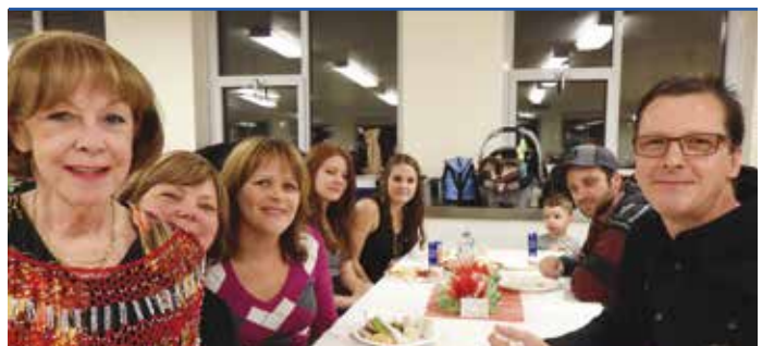
Des familles enthousiastes