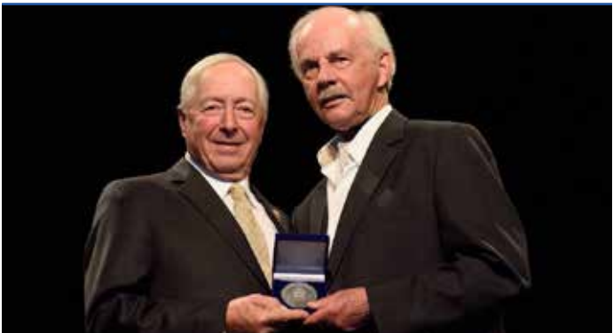
Médaille du lieutenant gouverneur du Québec pour bénévolat, 15 mai 2016.