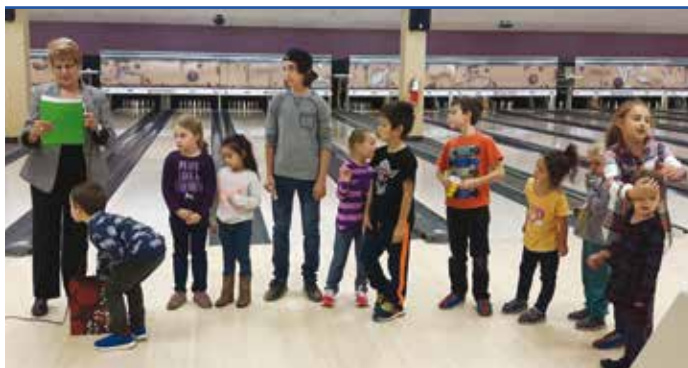
C'est l'heure des cadeaux. Les enfants sont mis à contribution.

La participation enthousiaste des joueurs s'est fait largement entendre à chacun de leurs bons coups et lors des différents tirages. En tout, une vingtaine de cadeaux ont été remportés par les participants grâce à la générosité de nos commanditaires. Également, trois (3) montants ont été remis suite au tirage du «prix de partage» soient: un (1) prix de 150$ et deux (2) prix de 100$.