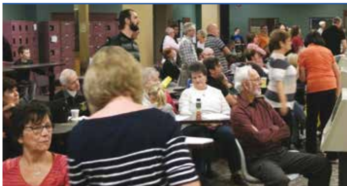
Un franc succès!

Le dimanche 23 octobre dernier, 180 personnes se sont données rendez-vous au Salon de quilles Moderne à Montréal pour soutenir la cause des laryngectomisés. Nous sommes très heureux de vous informer que nous avons récolté 3,500$, montant net qui sera versé à la Fédération québécoise des laryngectomisés (FQL) pour contribuer à la poursuite de ses objectifs et de sa mission.