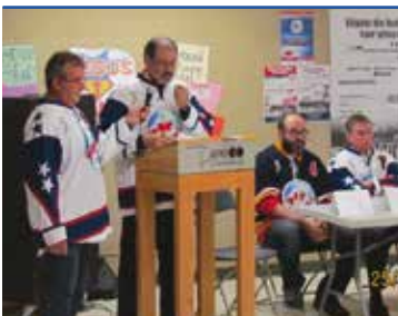
Conférence de presse 26 octobre 2016